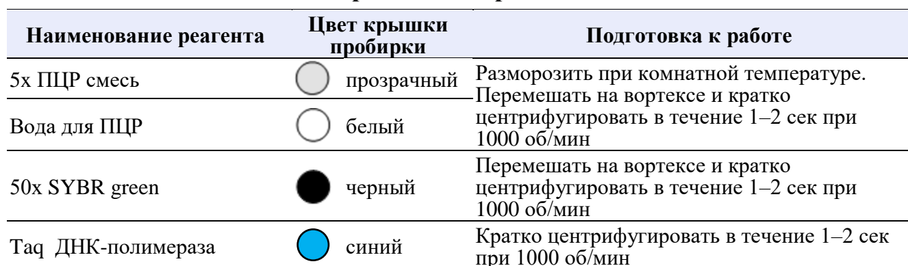
Таблица 8. Подготовка реагентов к работе

Не использовать вортекс для Тaq ДНК-полимеразы, это может привести к инактивации.