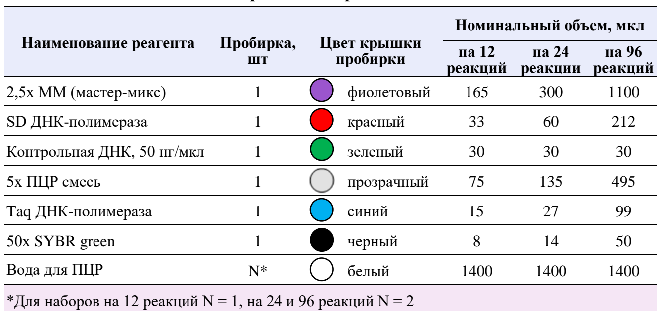
Таблица 1. Состав набора и объем реагентов

Состав набора и объем реагентов приведены в таблице 1.