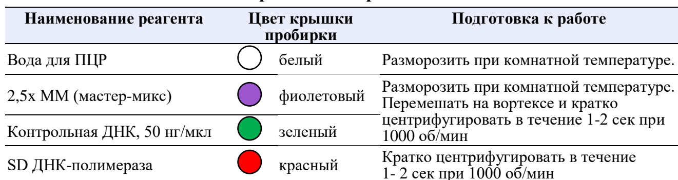
Таблица 5. Подготовка реагентов к работе

Не использовать вортекс для SD ДНК-полимеразы, это может привести к инактивации фермента.